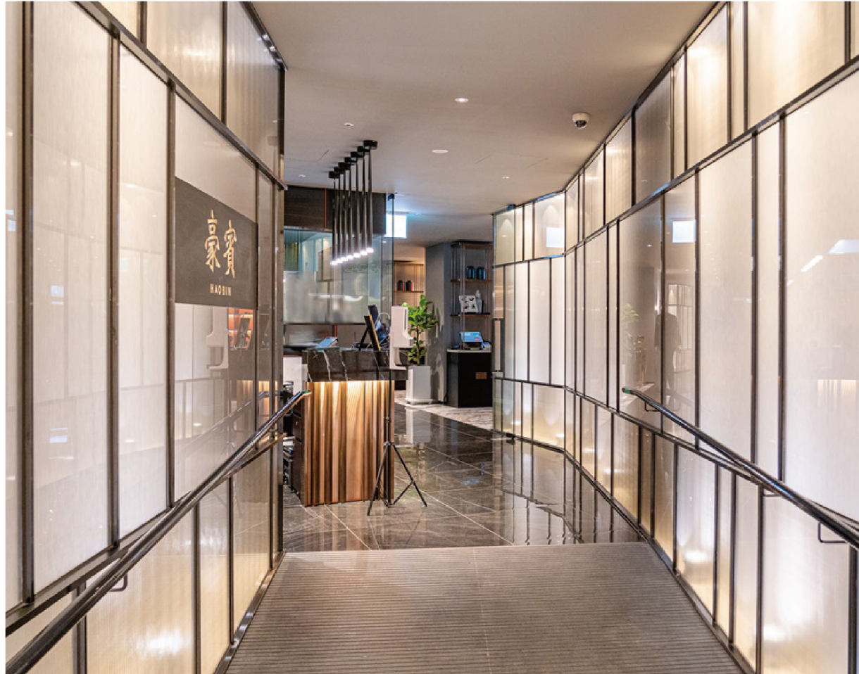
엠베서더 서울 풀만 중식당 "호빈"